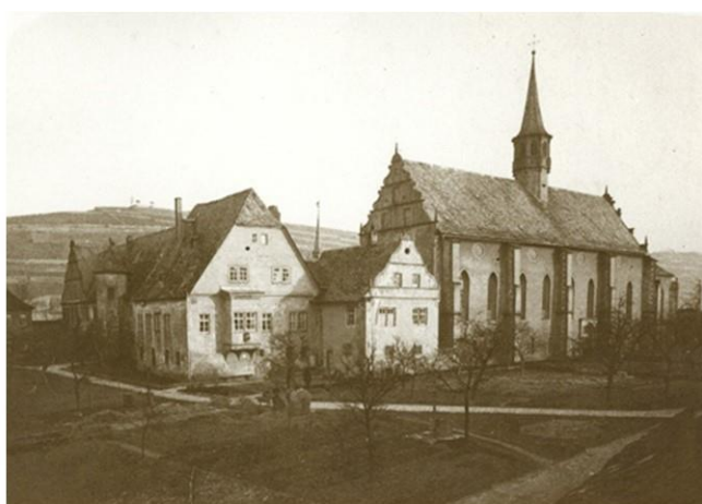
Würzburg, Carmelo de Himmelspforten

São palavras que condensam uma profunda experiência humano-espiritual na relação com Deus: "Amor Crucificado" 6 e, ao mesmo tempo, indicam a clareza do caminho a seguir e do objetivo a alcançar. Este caminho que conduz à "perfeição" está ligado à obediência 7 e passa por um espírito de simplicidade aliado à humildade 8 (no comportamento e na forma de se relacionar sem presunção, o que também leva a pedir perdão 9 ). Ela pede ao Senhor que guie a sua alma de uma forma simples, de acordo com a ordem natural da vida espiritual 10 .