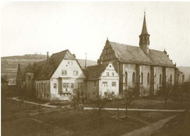
Würzburg, Carmelo di Himmelsporten